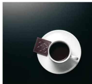
→ LuxMat® Laquéé Rojo Opera LuxMat® Laquéé Negro