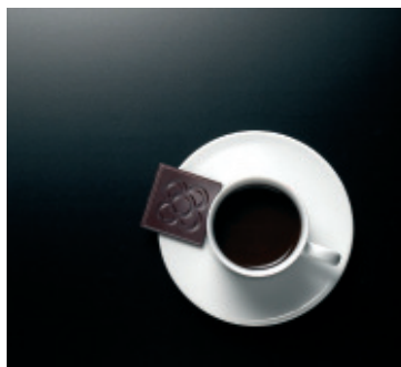
→ LuxMat® Laquéé Rojo Opera LuxMat® Laquéé Negro